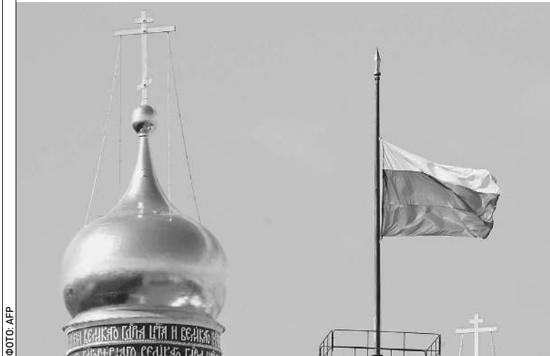
Вчера был день траура. Были приспущены государственные флаги России

Вспомним: 9 августа 1999 боевики Басаева вторгаются в Дагестан. В этот же день Борис Ельцин подписал указ о назначении Владимира Путина и.о. премьер-министра (через несколько дней он был утвержден Государственной думой). Это было еще до президентства 2000—2008 годов. Тогда, в августе-99, нужно было мобилизовать расхристанную страну на поход против бандитов. Премьер Путин с этим справился. А потом уже у президента Путина были другие испытания на прочность. Взрывы жилых домов в Москве и Волгодонске, теракты в Москве, Дубровка (2002), наконец, на верное, самое трагичное — Беслан (2004). → стр. 5