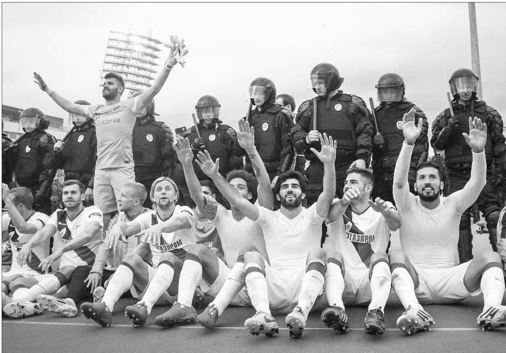
17 мая. Санкт-Петербург. «Уфа» - «Зенит» - 1:1. Питерский клуб - четырехкратный чемпион России!

Полную версию интервью читайте на сайте «СЭ» и в одном из ближайших номеров газеты.