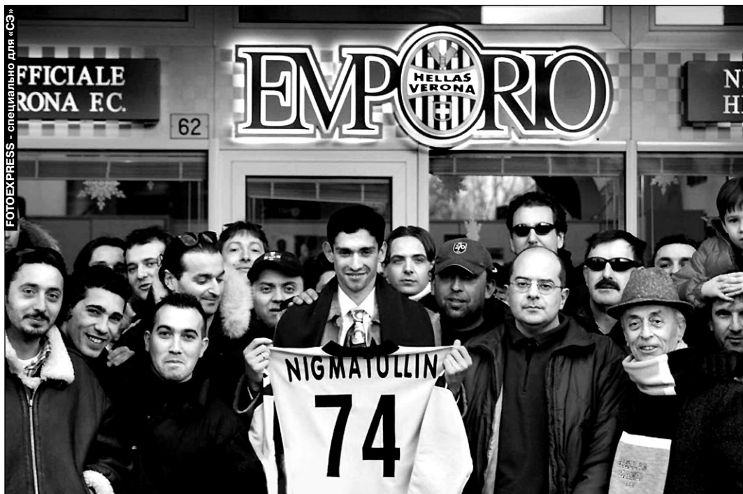
Вчера, Верона. Голкипер российской сборной Руслан НИГМАТУЛЛИН в окружении восторженных болельщиков своего нового клуба.