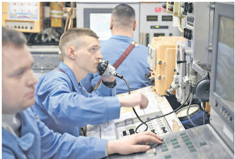
В центральном посту идёт тренировка.