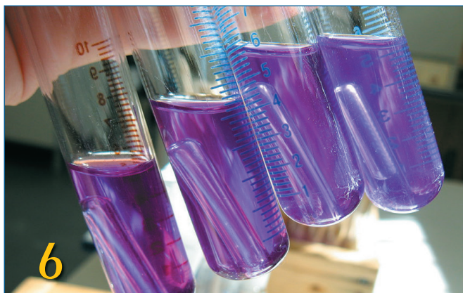
6 КОНТРОЛЬ БГКП В МОЛОЧНЫХ ПРОДУКТАХ И НА ОБЪЕКТАХ ПРОИЗВОДСТВЕННОЙ СРЕДЫ