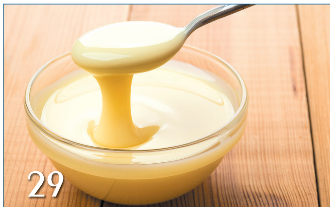
29 КОНСЕРВИРОВАННАЯ МОЛОЧНАЯ ПРОДУКЦИЯ С ЗАМЕНИТЕЛЕМ МОЛОЧНОГО ЖИРА: НОВЫЕ ТРЕБОВАНИЯ И АКТУАЛИЗИРОВАННЫЕ СТАНДАРТЫ ОРГАНИЗАЦИИ