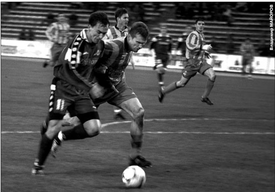
В 29-м туре 27 октября встречаются: СПАРТАК - ЗЕНИТ, РОТОР - ЛОКОМОТИВ, САТУРН - ТОРПЕДО, ДИНАМО - ЦСКА, ЧЕРНОМОРЕЦ - СОКОЛ, РОСТОВСКИЙ - АНЖИ, ТОРПЕДО-ЗИЛ - АЛАНИЯ, ФАКЕЛ - КРЫЛЬЯ СОВЕТОВ.

О матче «Крылья Советов» - «Динамо» и других событиях тура - стр. 3