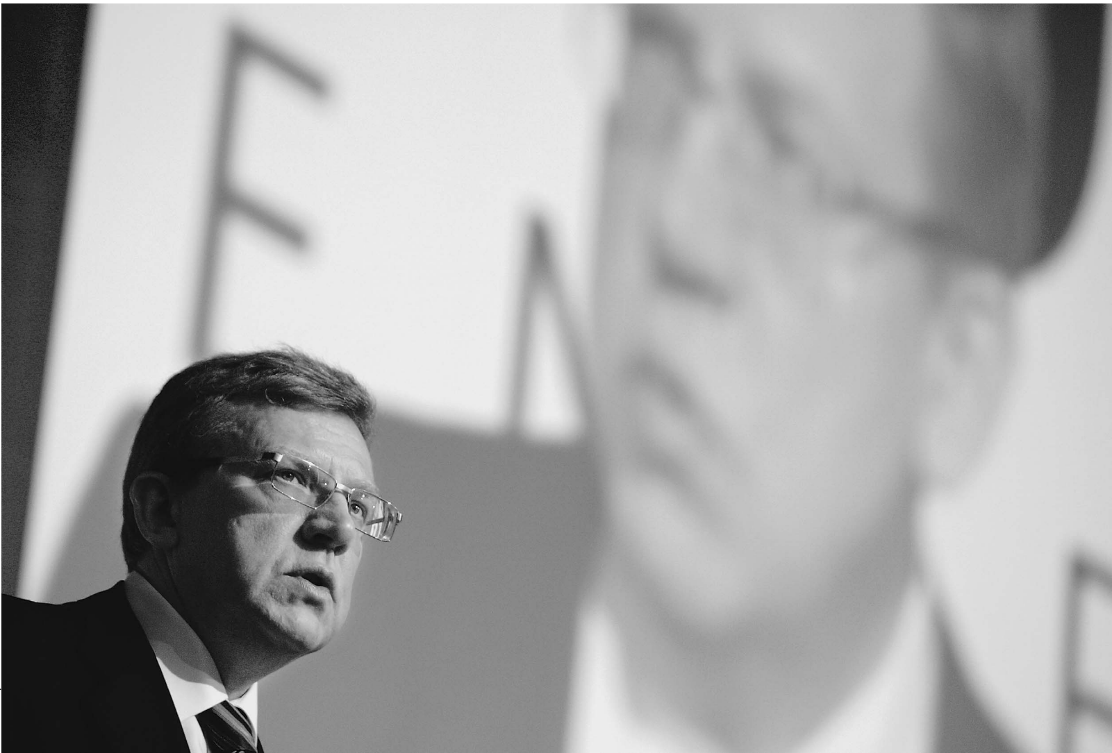
Глава Министерства финансов намерен сократить разрыв в доходах российских граждан

Министр финансов выступил с программным заявлением о том, как России жить дальше