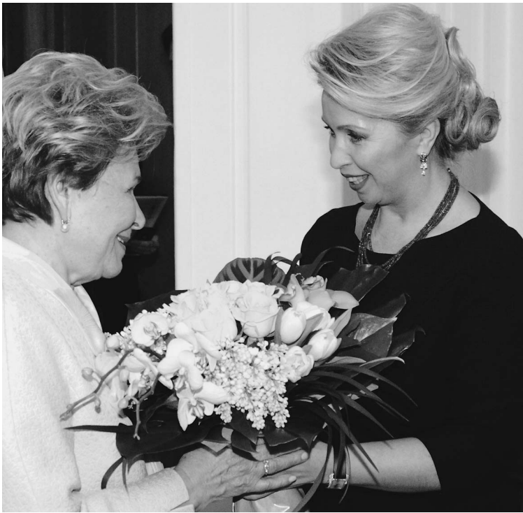
Наина Ельцина и Светлана Медведева