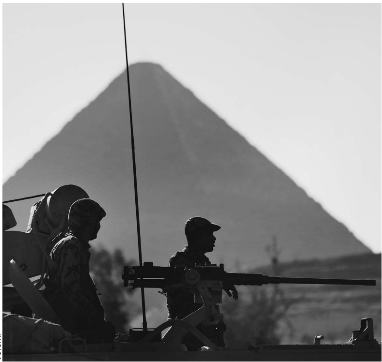
Популярные у туристов маршруты патрулируют танки, но россияне это не путают