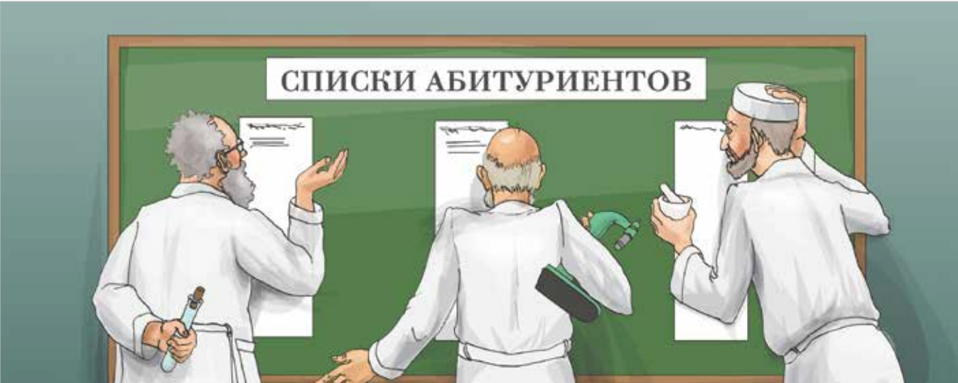
РИС. А. ЦЕРБАКОВОЙ

В вузах стартует приемная кампания-2024. Она заставит понервничать не только абитуриентов. Годом ранее в ряде учебных заведений остались частично не востребованными не только платные, но и бюджетные места по специальности «Фармация». Стипендии отличникам от крупных аптечных сетей, обучение будущих провизоров фитотерапии и отказ от первичной аккредитации в пользу практики защиты дипломов — такие предложения высказывают представители высшей школы в качестве возможных рецептов повышения привлекательности высшего фармобразования.