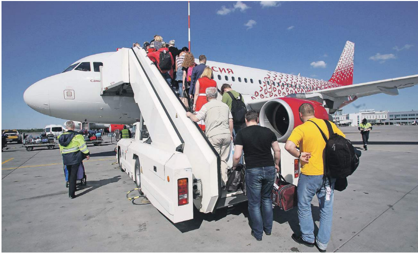
Изменения в воздушное законодательство планируют внести до конца года