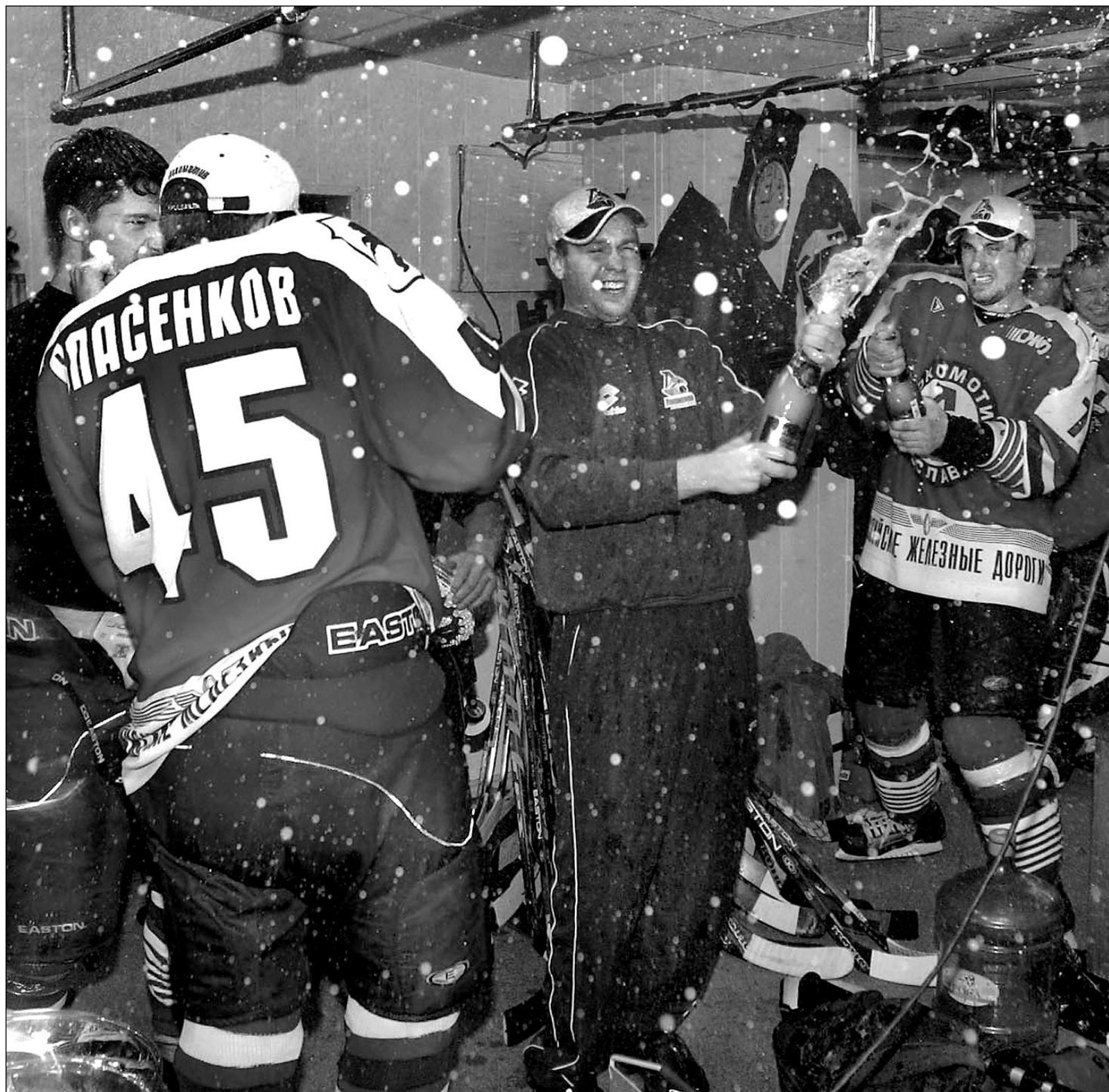
Вчера. СКЗ «Алмаз». «Северсталь» - «Локомотив» - 0:4. Шампанское в раздевалке «Локомотива»!

Кубок ходил по рукам - как пушинка. И шампанского хватало на всех. Даже на спецгруппу «СЭ».