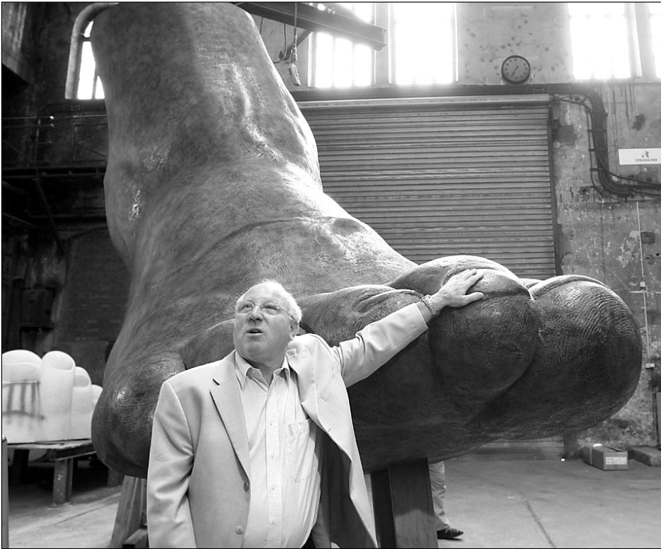
Гамбург. Уве Зеелер на фоне своей правой ноги, отлитой в бронзе.

дир бундеслиги (1964). В бундеслиге провел 239 матчей (все за «Гамбург»), забил 137 голов, в составе сборной - 73 (43). Награжден высшим орденом Германии «За заслуги». Официальный посол мирового чемпионата-2006 от Гамбурга.