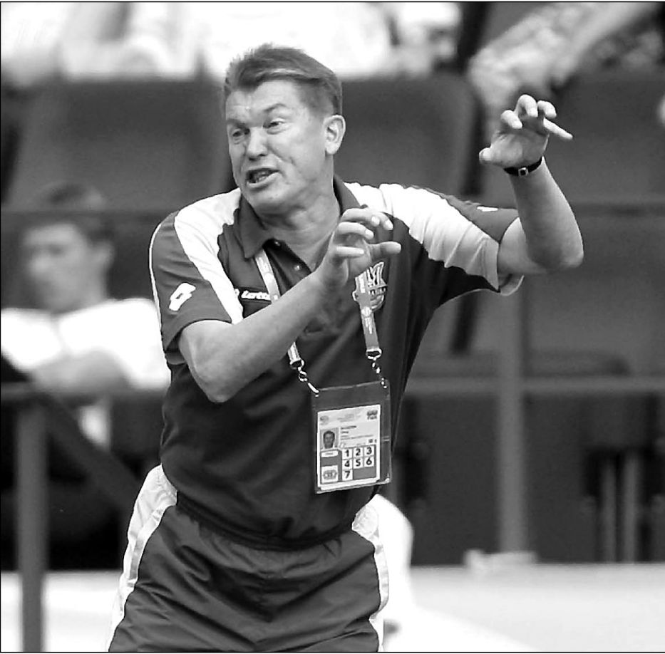
Олег БЛОХИН готов сменить прическу. Дело за его командой.

Репортажи специальных корреспондентов «СЭ» и другие материалы о ЧМ-2006 - стр. 2 - 10