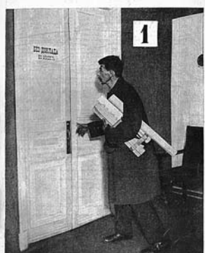
ДВЕРИ ДОЛЖНЫ РАСПЯХИТЬСЯ

Первый номер журнала «ИЗОБРЕТАТЕЛЬ» открывает статья Альберта Эйнштейна «Массы вместо единиц», где великий ученый говорит, что время гениальных изобретателей-одиночек прошло, наступает замечательная эпоха коллективного изобретательства. В этой январской книжке новорожденного издания блистательный подбор авторов. Со статьями выступают крупные государственные и партийные деятели — В.Куйбышев, Л.Каменев, замечательные писатели — М.Пришвин, В.Шкловский, Н.Погодин, знаменитый журналист М.Кольцов, академики, выдающиеся инженеры и простые рабочие. Печатается бюллетень важнейших государственных решений по изобретательским делам, в том числе о привилегиях, помогавших тогдашним изобретателям жить и заниматься творчеством.