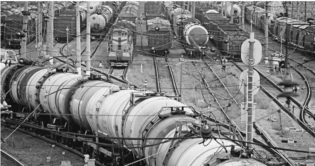
Росимущество проведет аудит деятельности железнодорожной монополии