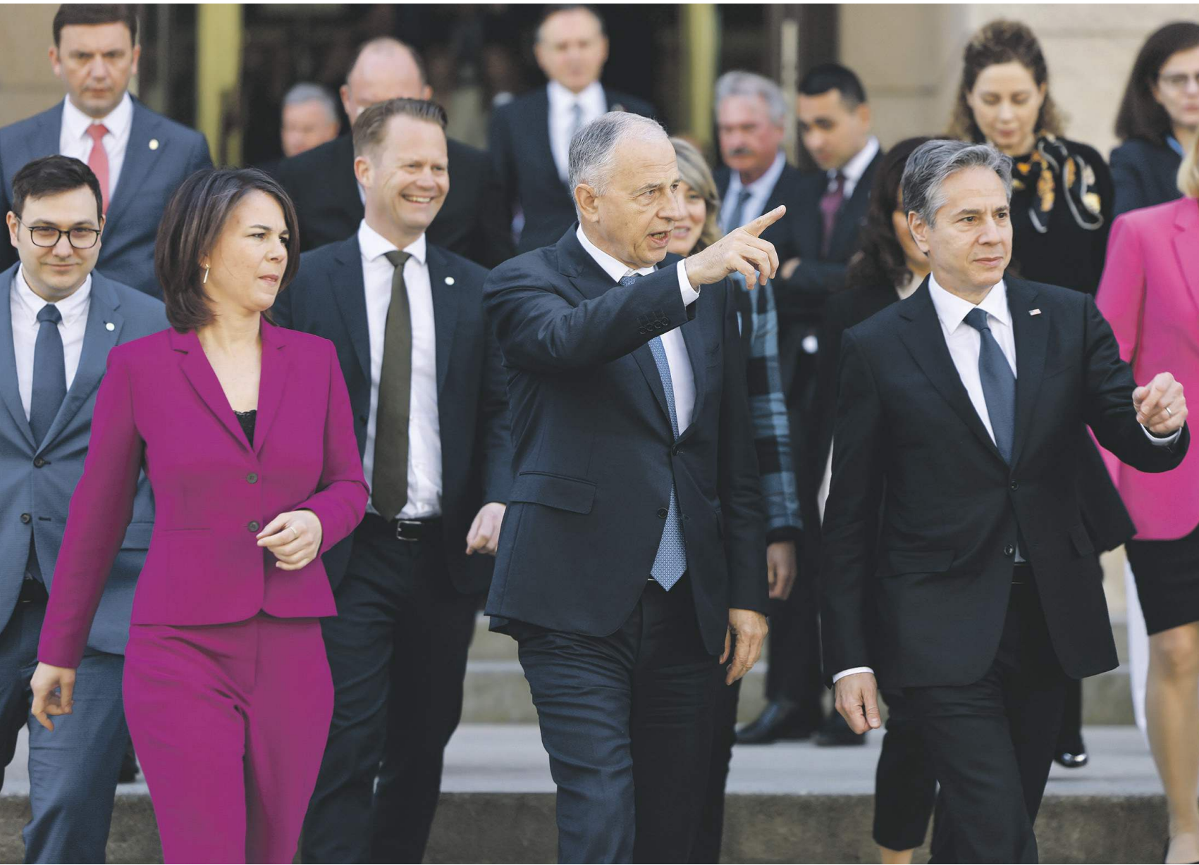
На неформальной встрече глав МИДов стран НАТО 15 мая большинство членов организации выступили за приём Финляндии и Швеции в свои ряды

— Когда мы смотрим на Россию, мы наблюдаем совершенно другую Россию по сравнению с той, что мы видели несколько месяцев назад. Всё изменилось после того, как Россия [начала спецоперацию] на территории Украины, и я лично думаю, что мы больше не можем верить в мирное будущее рядом с Россией, — сказала на пресс-конференции Санна Марин.