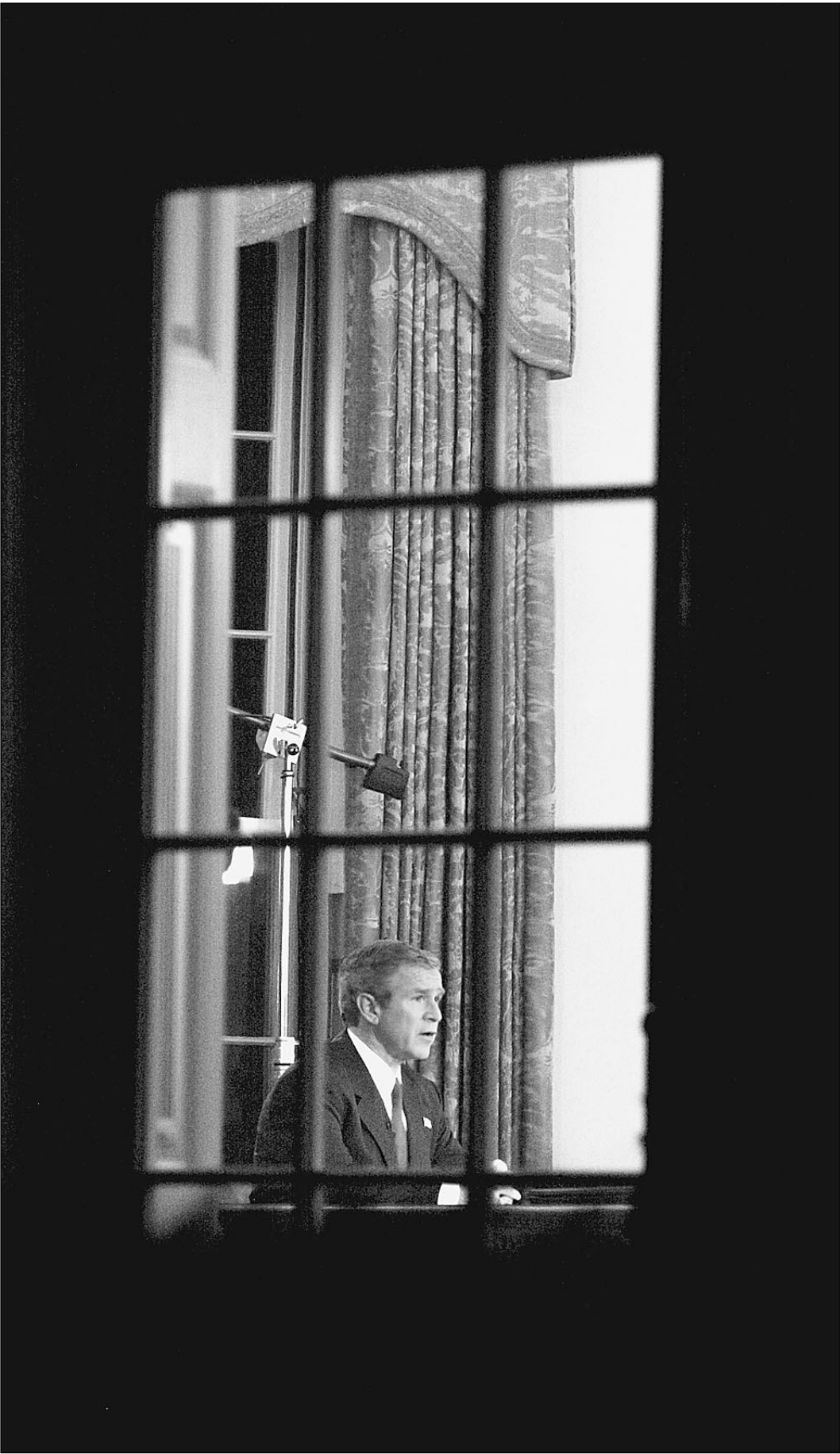
Джордж Буш объявляет войну за мир во всем мире

20 марта в 05.33 по московскому времени в Багдаде завывли сирены, раздалась первые взрывы. Иракская война началась. Пока не понятно, идет ли речь о масштабных бомбардировках или о «точечных ударах» по избранным целям. 05.36. Очевидцы наблюдают в небе над Багдадом несколько самолетов. Иракские средства ПВО ведут по ним огонь. 05.45. Белый дом распространил официальное заявление: военная операция против Саддама Хусейна началась. В скором времени ожидается обращение к нации президента Буша. 05.50. Организация стран — экспортеров нефти (ОПЕК) обещает не допустить перебоев с поставками энергоносителей на мировой рынок. 05.56. Американское военное командование на арабском языке обратилось к населению Ирака. При этом были использованы частоты иракской государственной радиостанции. «Наступил день, которого все мы ждали», — говорится в обращении. 06.01. Представители администрации США заявляют, что целью первых ударов была ликвидация руководства Ирака. То есть речь пока идет о «точечных операциях». Масштабные бомбардировки еще не начинались.