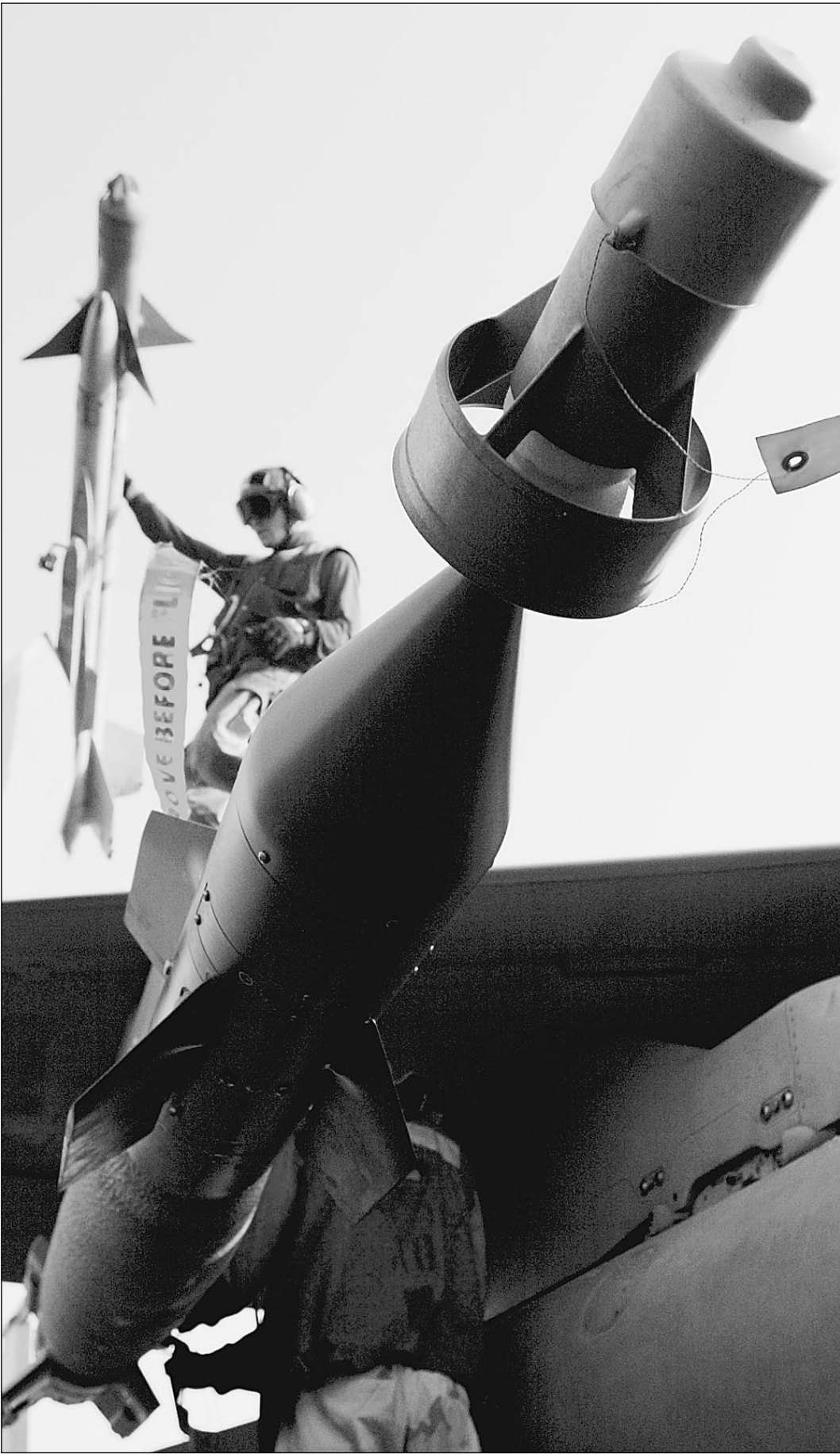
Война за мир во всем мире. День первый

07.48. Иракское телевидение сообщает, что в ближайшее время с обращением к нации выступит Саддам Хусейн. 07.53. Пентагон заявляет, что параллельно с боевыми действиями в Ираке начата крупная операция на юге Афганистана — в районе Кандагара. В ней участвуют «не менее тысячи» американских военнослужащих. 07.56. Представитель иракской армии заявил, что США и их союзники нанесли удар по «ряду воен-