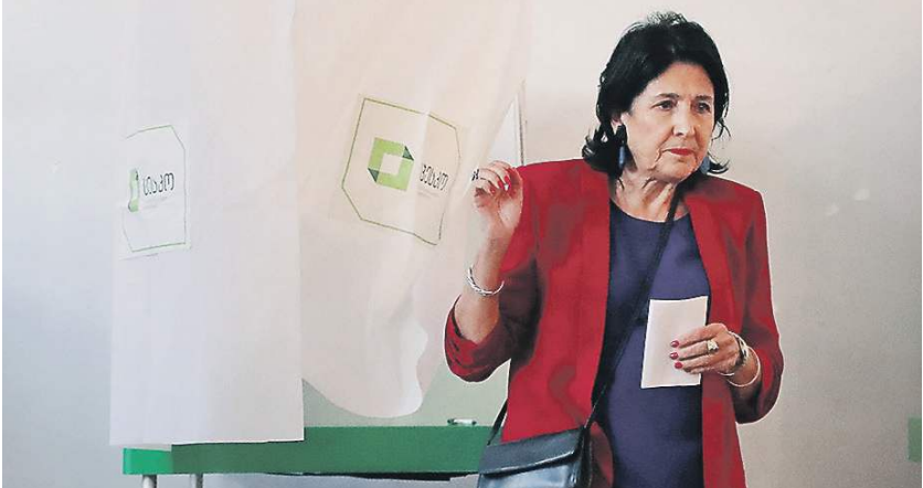
Одним из основных кандидатов в президенты Грузии является бывшая глава МИД страны Саломе Зурабишвили