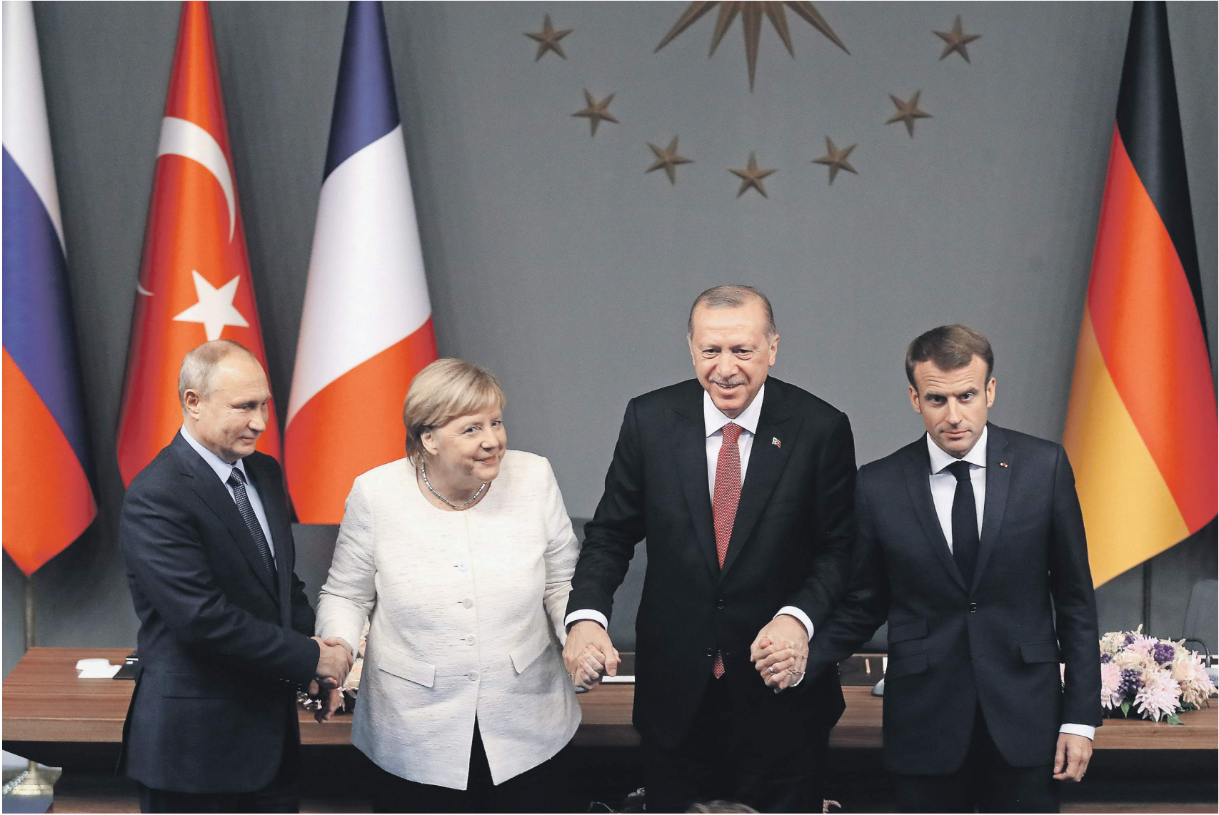
Лидеры России, Германии, Турции и Франции договорились теснее сотрудничать на Ближнем Востоке | Александр Казаков | «Известия»