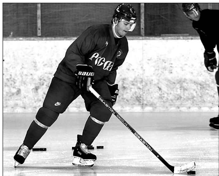
Вчера. Новогорск. 17.15. Один из лучших защитников НХЛ Олег ТВЕРДОВСКИЙ на первой тренировке в сборной России призыва-2001.

- Вот и я считаю, что был прав. А жизнь всех поставила на свои места.