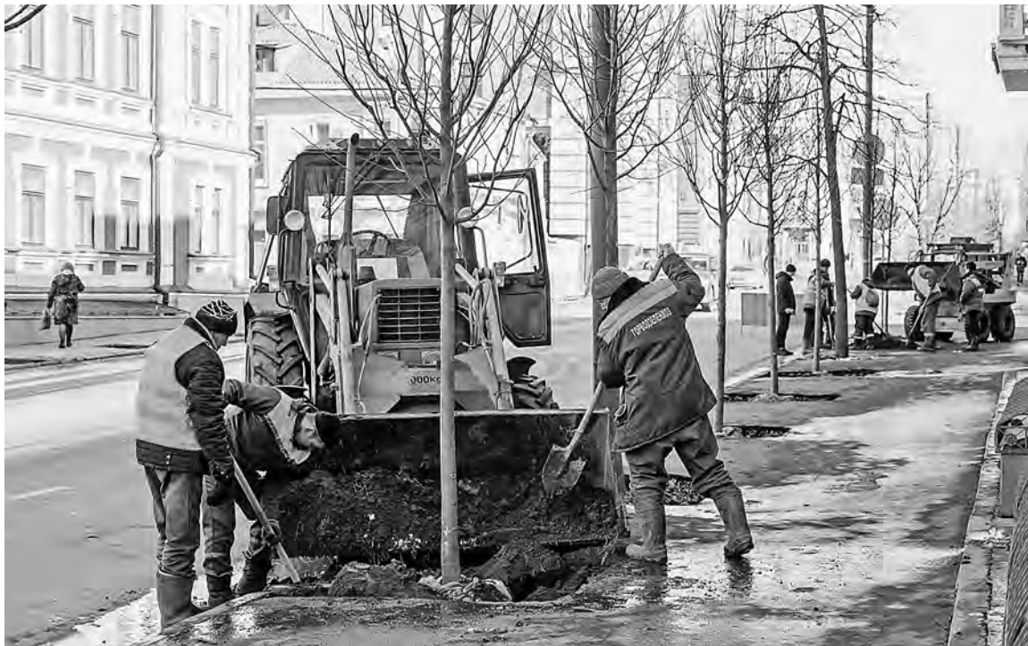
Более ста саженцев крупномерных лип, выращенных в тульском питомнике, высадили в центре Казани на улице Большой Красной сотрудники Горводзеленхоза. И это лишь начало «зеленой реконструкции». Всего в этом году в городе появится более восьми тысяч новых деревьев вдоль 22 улиц.

ЭТО связано с погодными условиями. Есть опасения, что из-за весенней распутицы работники почты не смогут своевременно доставить деньги жителям отдаленных населенных пунктов Звениговского, Мари-Турекского и Моркинского районов. Поэтому почтальоны отделений связи в деревне Липша, поселках Черное озеро, Новоапавловский и Комсомольский посетят пенсионеров до третьего апреля включительно.