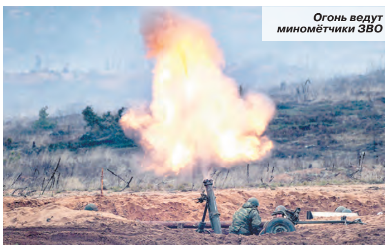
Огонь ведут миномётчики ЗВО