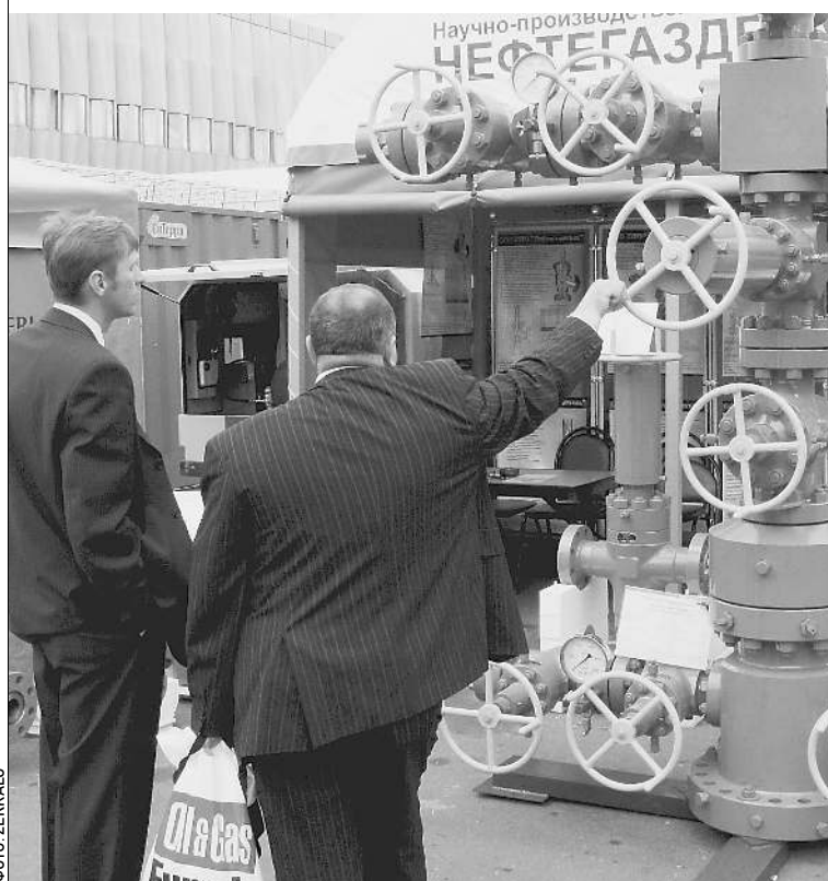
Наш газовый вентиль оказался хорошим щитом

была минусом. Вспомним хотя бы Украину, которая неохотно и с боями соглашалась повышать цену покупки российского газа до уровня мировой. Теперь все наоборот. Нефть дешевеет, а газ нет. Впрочем, и с нефтью никакой катастрофы пока не произошло. Ведь еще в начале 2007 года наше «черное золото» стоило лишь $54 и все вокруг дивились «невероятному росту цен». → стр. 6