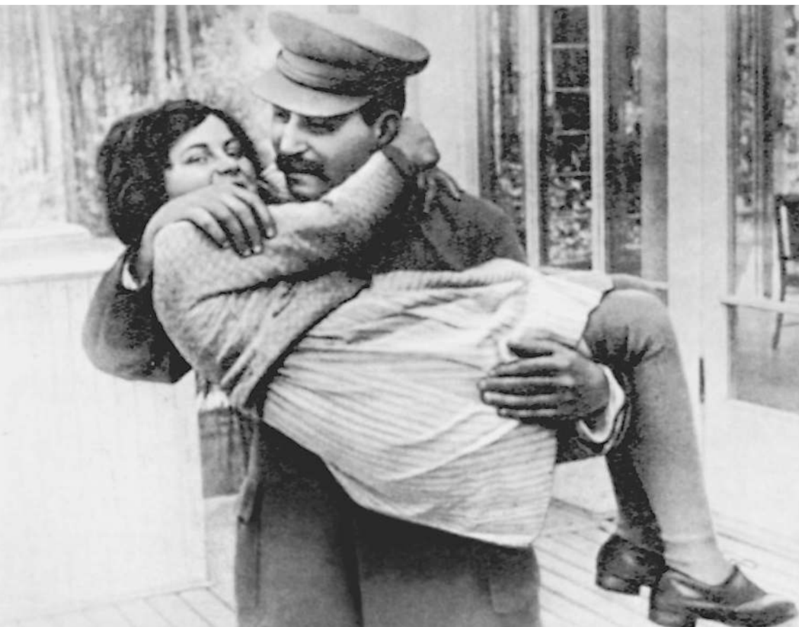
Самая известная фотография вояды с дочерью. 1936 год