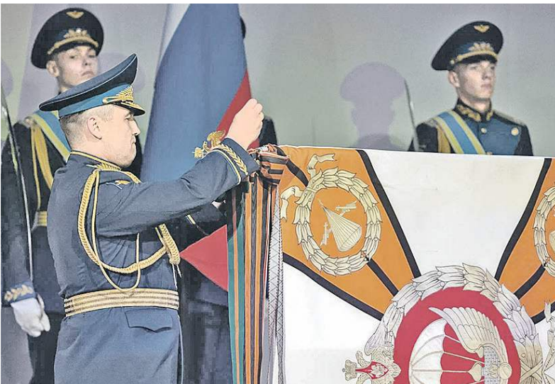
За вклад в укрепление обороноспособности страны.