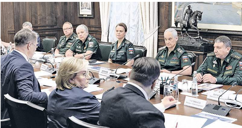
Новые технологии будут внедряться без проволочек.