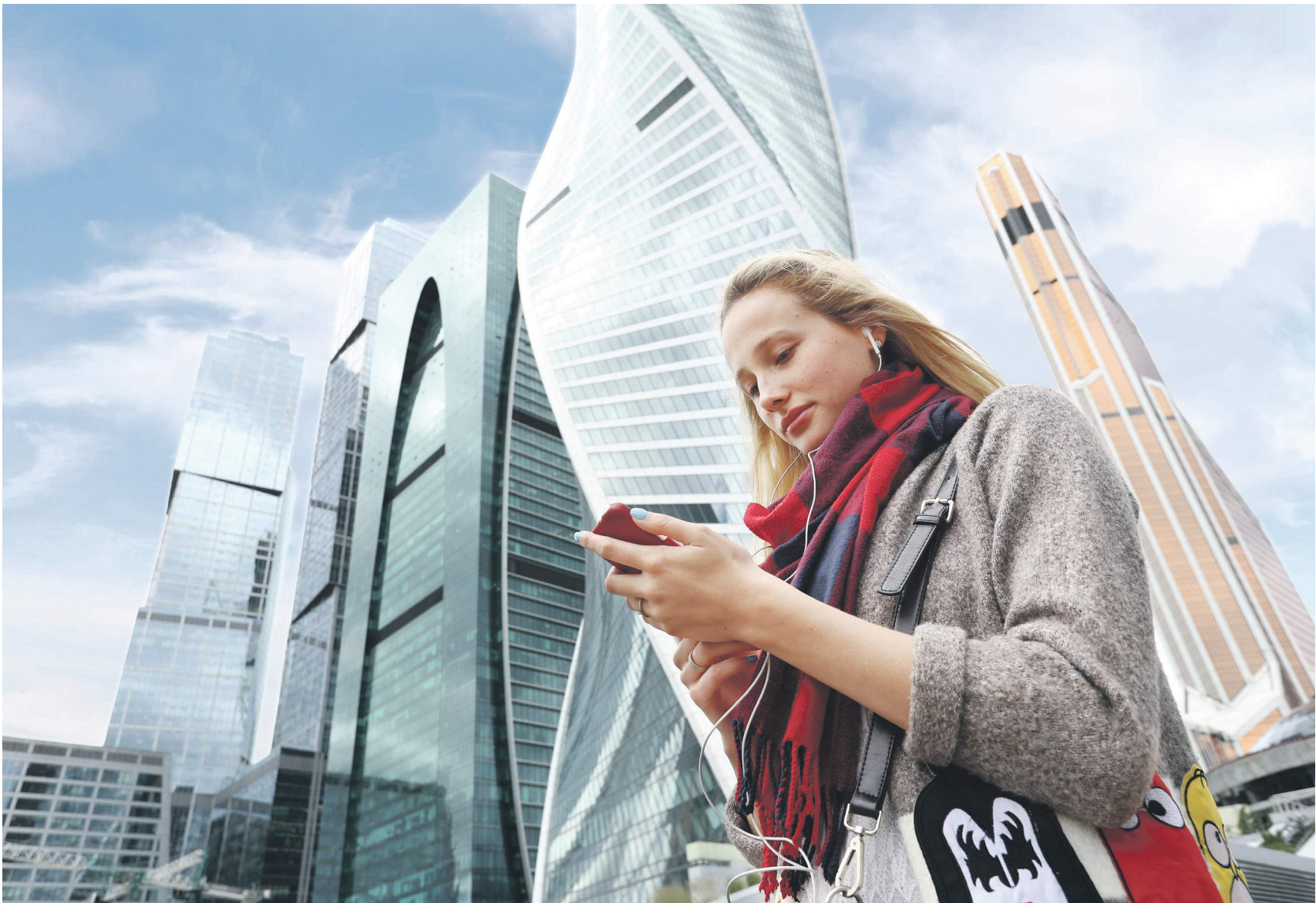
Переводы через мобильные приложения банков набирают популярность