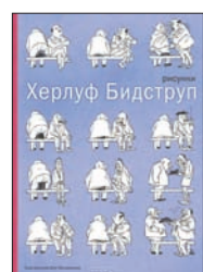
Бидstrup Х. Рисунки. М.: Издательский дом Мещерякова, 2012. — 224 с.

5 Всем, кто любит посмеяться добрым смехом над чужими ляпами, проколами и перегибами на месах, да и самого себя не боится узнать в «веселых картинках», — подарочное издание с лучшими работами выдающегося художника-юмориста Херлуфа Бидструпа.