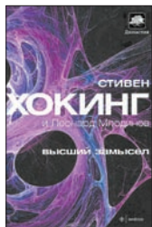
Хокинг С., Млодинов Л. Высший замысел / Пер. с англ. М.Кононова. СПб.: Амфора. ТИД Амфора, 2012. — 208 с.

4 Стивен Хокинг и Леонард Млодинов отважно берутся за проблемы, веками волновавшие философов, — как возникла Вселенная? Существует ли Бог? Какова природа реальности? Что нас ждет после смерти? По мнению ученых, современная наука способна дать ответы на вечные вопросы прямо сейчас.