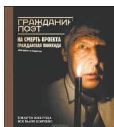
Гражданин поэт. Наши - все! (+DVD) СПб.: Азбука, Азбука-Аттикус, 2012. — 152 с.

6 Это второй и последний том эпического проекта «Гражданин поэт». Под обложкой — 22 номера Художественной Самостоятельности, в которых классики мировой литературы обсуждают злободневные темы отечественной политики, новый раздел «Граждане Вещи», фоторепортаж о трудовых буднях Михаила Ефремова, концертные экспромты Дмитрия Быкова и еще много приятного.