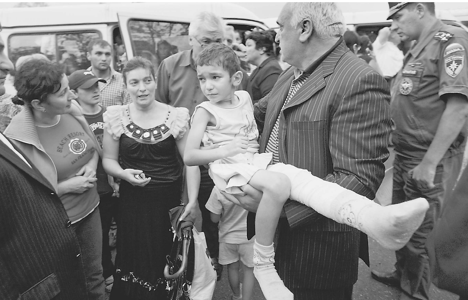
Из Цхинвали вывозят детей , спасая их от войны

Спецкор «Известий» передает из прифронтового Цхинвали