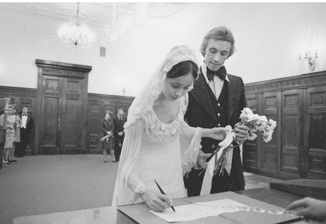
Надежда Павлова и Вячеслав Гордеев. Декабрь 1975 года