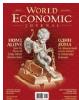
#5 (15) Illustration by Oleg Babkin