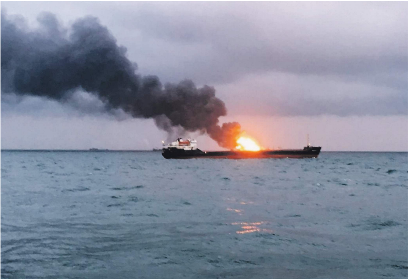
Несмотря на ЧП, затруднений судоходства по Керчь-Еникальскому каналу нет | РИА Новости | Керчь ФМ | Роман Яндолин

— У нас есть информация, что это «Кандий». Но, возможно, у судна двойное название, — предположил он.