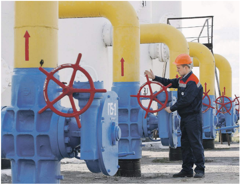
Новый контракт по транзиту будет обсуждаться после того, как «Газпром» и «Нафтогаз» урегулируют судебные споры