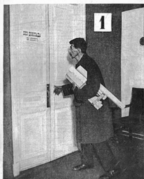
Двери должны распахнуться

Первый номер журнала «ИЗОБРЕТАТЕЛЬ» открывает статья Альберта Эйнштейна «Массы вместо единиц», где великий ученый говорит, что время гениальных изобретателей-одиночек прошло, наступает замечательная эпоха коллективного изобретательства. В этой январской книжке новорожденного издания блистательный подбор авторов. Со статьями выступают крупные государственные и партийные деятели — В.Куйбышев, Л.Каменев, замечательные писатели — М.Пришвин, В.Шкловский, Н.Погодин, знаменитый журналист М.Кольцов, академики, выдающиеся инженеры и простые рабочие. Печатается бюллетень важнейших государственных решений по изобретательским делам, в том числе о привилегиях, помогавших тогдашним изобретателям жить и заниматься творчеством.