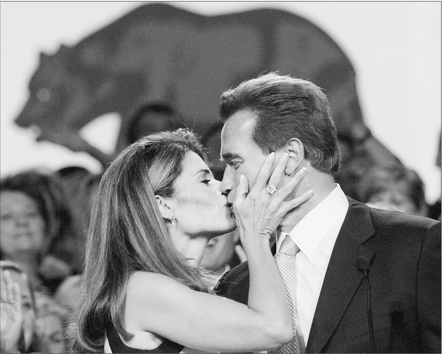
Губернатор Арнольд Шварценеггер и его жена Мария — главные триумфаторы калифорнийских выборов

И еще одно значение «свыше» — из Голливуда: исторический диалог между кинорежиссером Джорджем Батлером и кинозвездой Кандис