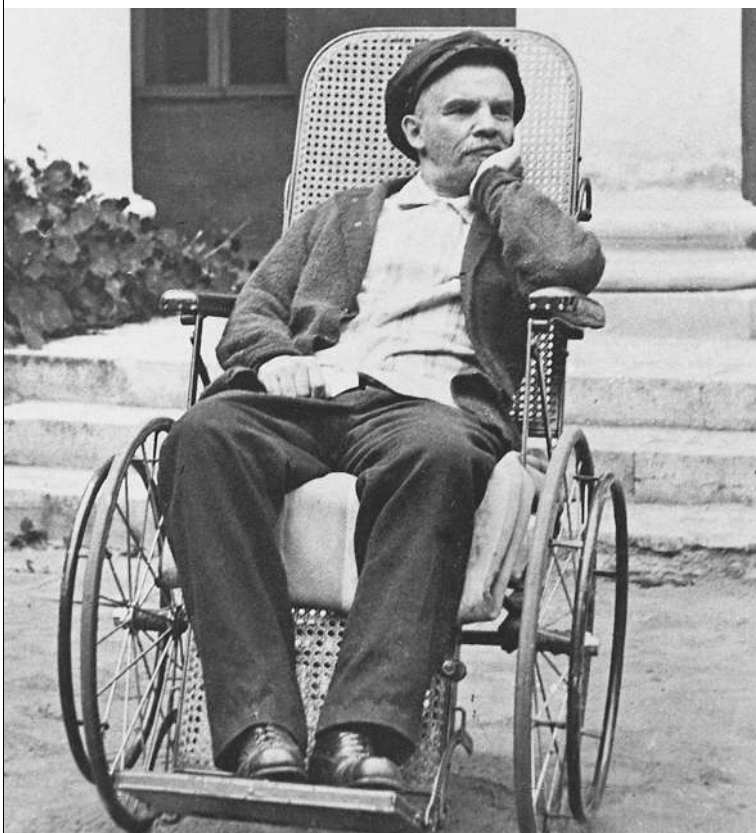
В телеигре «Лицо России» Ильич вряд ли вошел бы в число финалистов

площади в аренду. Современное имя России — точно не «высокоразвитая промышленная держава» или «лидер в области наукоемких производств». С другой стороны, завод уже 76 лет специализируется на контрольно-измерительных приборах — а чем, если не замером общественного мнения, заняты организаторы и вдохновители «Имени...»? Ну, и контролем в каком-то смысле тоже. Что хорошо известно, на то легче влиять. → стр. 11