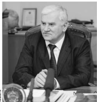
Теперь экс-мэру придется самому отвечать на вопросы

В 2010 году Сердюков расследовал дело о неудавшихся те-