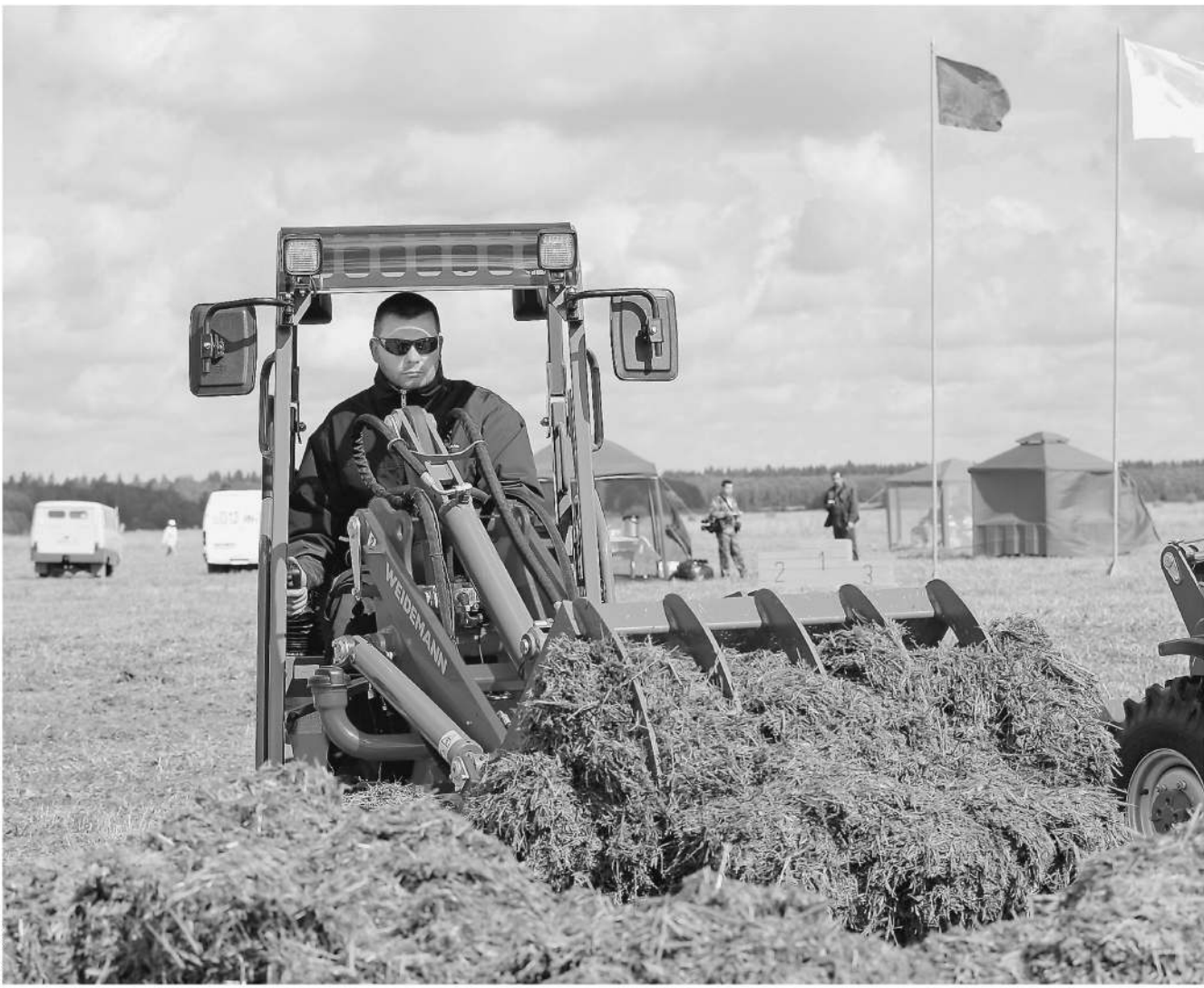
О силосе в Нижегородской области позаботились по-хозяйски — дважды

Нижегородские аграрии, по версии следствия, дважды собрали деньги на строительство одного и того же здания