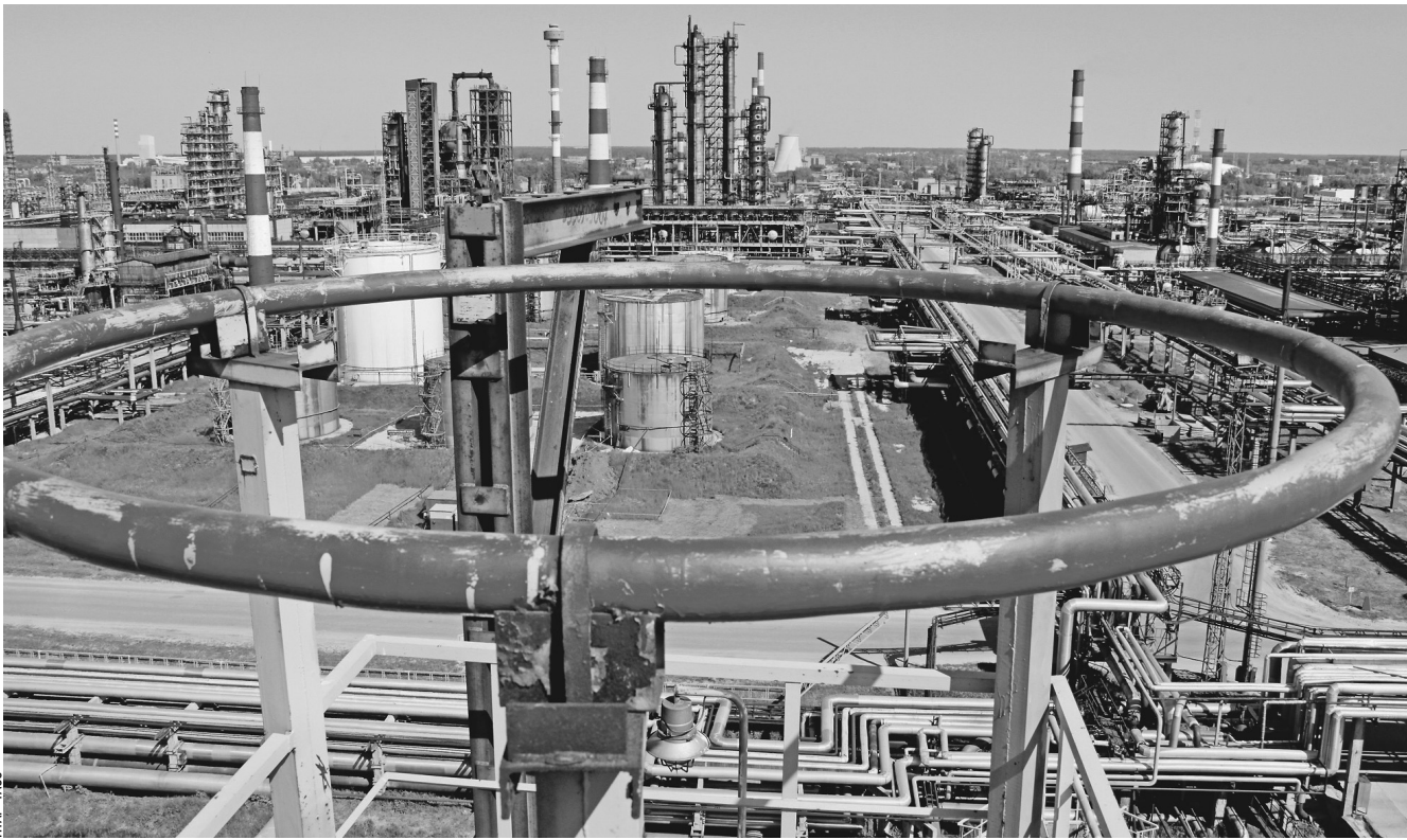
Чобы повысить конкуренцию на рынке нефтепродуктов, правительство намерено приобрести у крупных игроков один из нефтеперерабатывающих заводов для поддержки мелких компаний, у которых возникают проблемы с переработкой собственного сырья