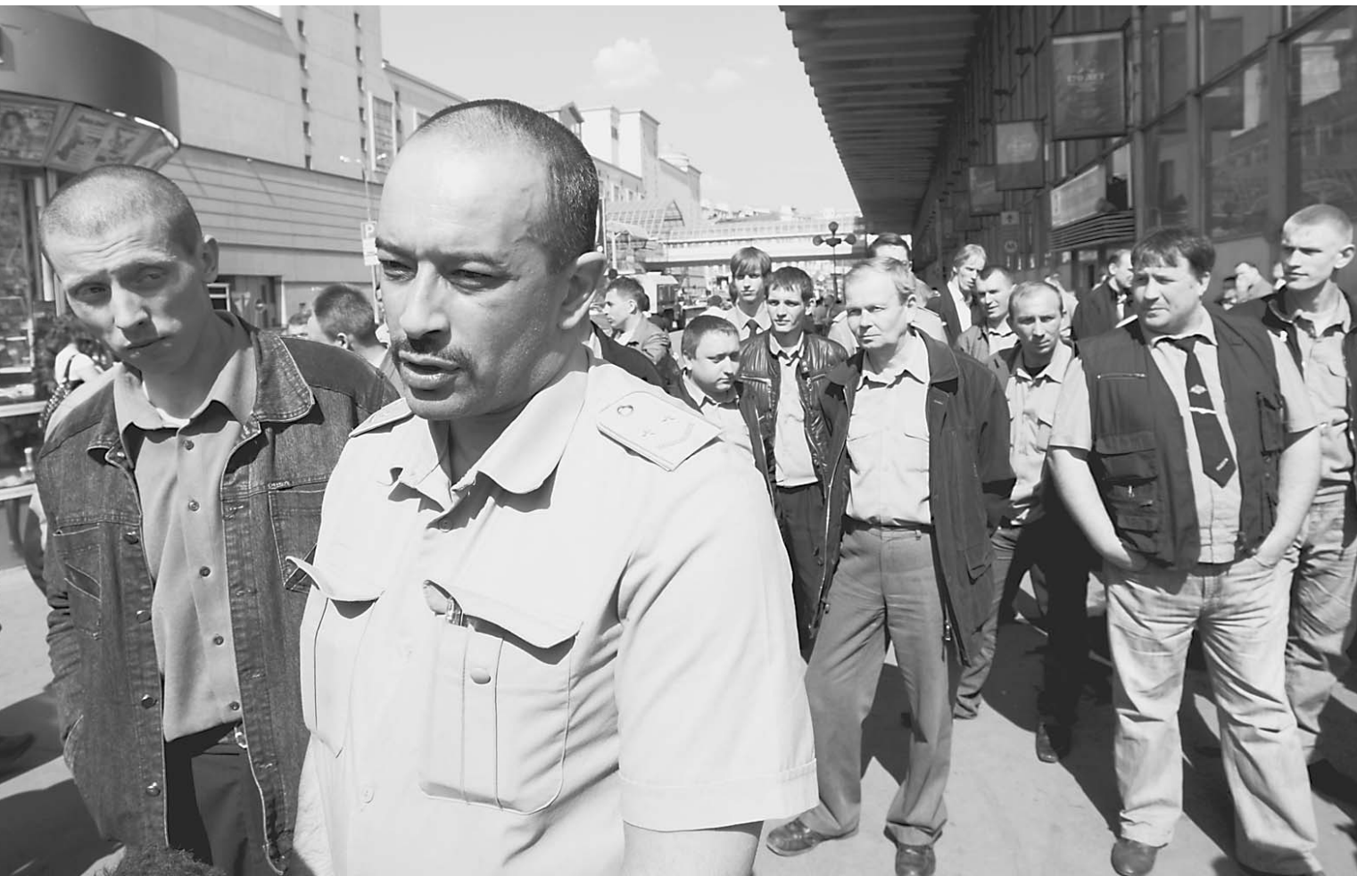
Москва, 28 апреля, Курский вокзал. Бригада машинистов, объявивших забастовку

Забастовку машинистов не поддержали тысячи жителей Подмоскovie, опоздавших на работу