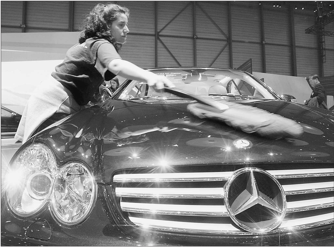
«Мерседес» — не роскошь, а средство передвижения депутата

Одно плохо: даже самая «навороченная» иномарка — это машина простого смертного. С обычными номерами. Депутаты Госдумы прошлого соизвола вдруг поняли, что закон в их собственных руках. В 1999 году они радикально обновили закон о своем статусе, вписав туда такую фразу: «служебный автотранспорт,