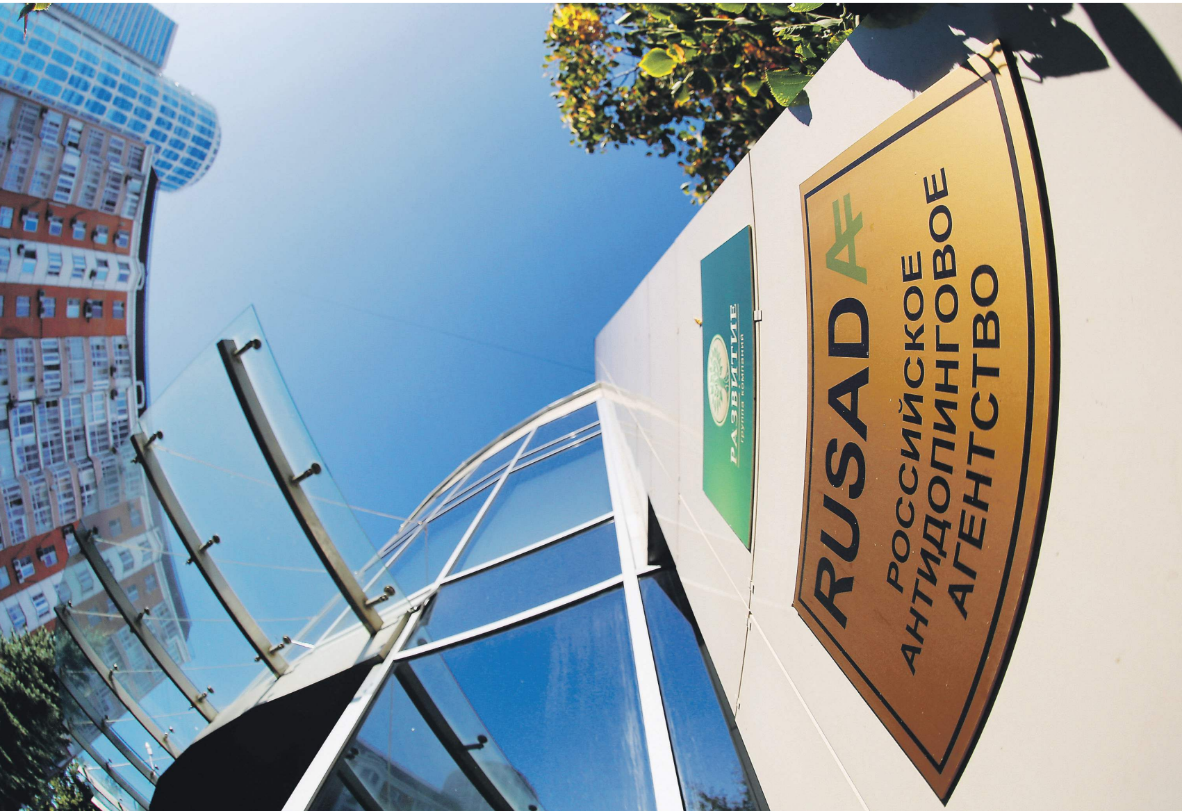
РУСАДА снова уполномочено проверять спортсменов для международных соревнований

— Это признание работы целой команды. Помимо нас это специалисты Минспорта, эксперты ВАДА, антидопинговые агентства других стран, которые оказывали нам помощь, когда это было необходимо, — пояснила она «Известиям». — Теперь РУСАДА функционирует в полном объеме. Во-первых, мы теперь будем самостоятельно выдавать терапевтические разрешения. Ранее это делало Британское антидопинговое агентство (UKAD). Во-вторых, мы получили возможность тестировать российских спортсменов не только внутри страны, но и за границей. В-третьих, сотрудники РУСАДА могут выдвигать свои кандидатуры в комитеты и комиссии ВАДА, что было запрещено почти три года. Ду-