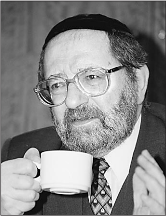
ноценными гражданами России, все-таки будут ценить то, чем жили многие поколения до них.

Сильно сказывается тот промежуток времени, когда нас отлучали не только от религии, но вообще от еврейства. Мы потеряли язык, громадное количество людей, знающих традицию, и все это не могло не сказаться. У нас нет статистики, но я думаю, два-три процента от проживающих сегодня в России евреев соблюдают все, что предписано религиозными канонами, живут по ним. Еще какой-то процент, тоже небольшой, приходят в синагогу по субботам, по праздникам. Появилась молодежь, которая интересуется, но большого всплеска нет. Тем не менее я надеюсь, что евреи, оставаясь пол-