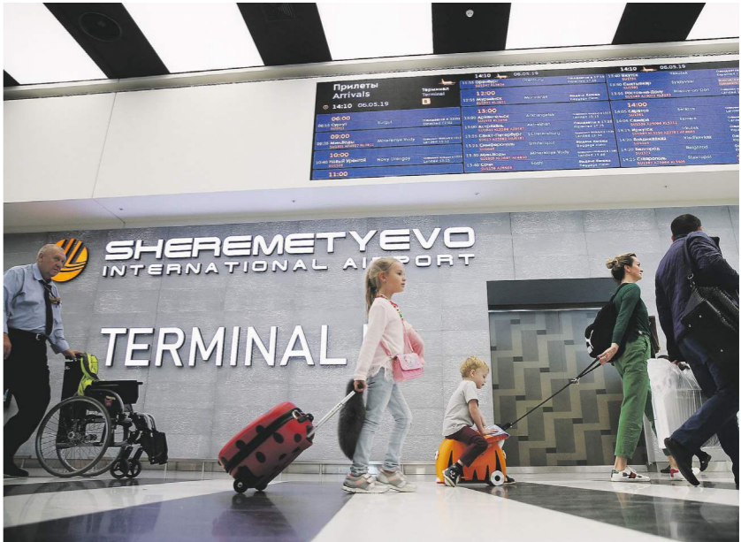
Геннадий Баранов / ИТАР-ТАСС