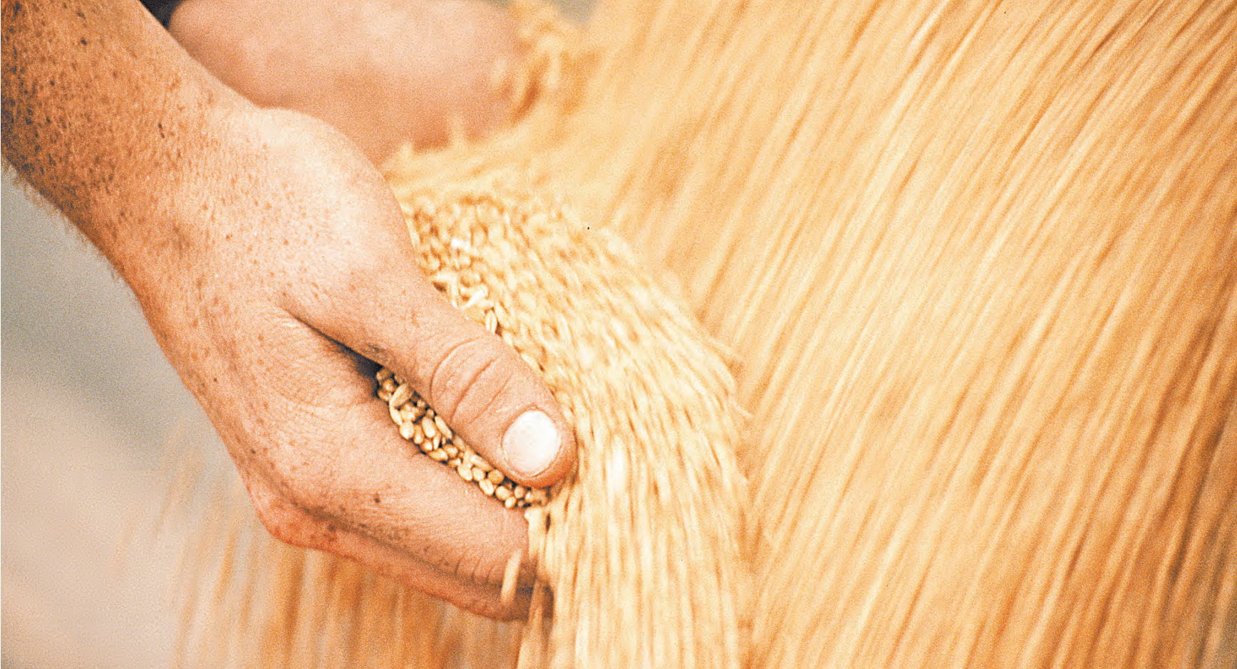
При невероятном спросе на российское зерно экспортеры выбрали чуть более 70% экспортных квот от общего объема, в том числе порядка 60% — по пшенице.

В целом и мы делали примерно то же самое, но я смею вас заверить, и результат очевиден, налицо: мы делали это гораздо более аккуратно, мы делали это точно, добивались нужного результата без того, чтобы все эти действия отразились на макроэкономических показателях, в том числе на безмерном росте инфляции.