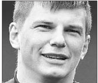
Андрей АРШАВИН 22 ГОЛА