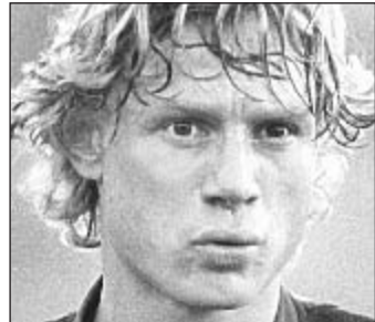
Валерий КАРПИН 21 ГОЛ