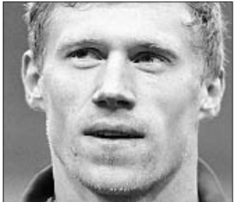
Павел ПОГРЕБНЯК 21 ГОЛ