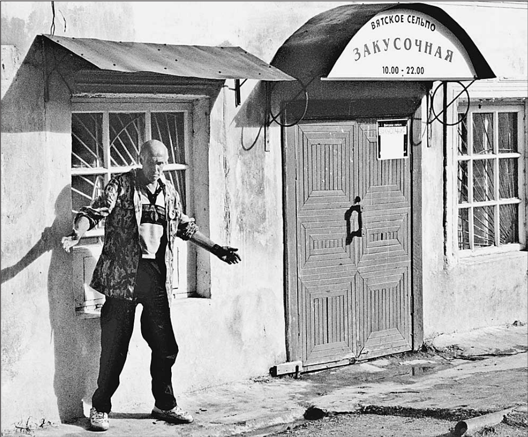
Закусочная. Кировская область

За два года число богатых людей в России увеличилось в 2,5 раза, причем регионы в этом смысле почти не отстают от столицы. А тех, кому денег не хватает даже на еду, в Москве стало вдвое меньше, в остальных регионах — на треть. Тем не менее Москва по потребительским стандартам пока все равно остается государством в государстве. Такой результат показала выборка ежегодного исследования R-TGI группы компаний КОМКОН. На вопросы социологов отвечали 36 тысяч респондентов из провинции и 6 тысяч москвичей.