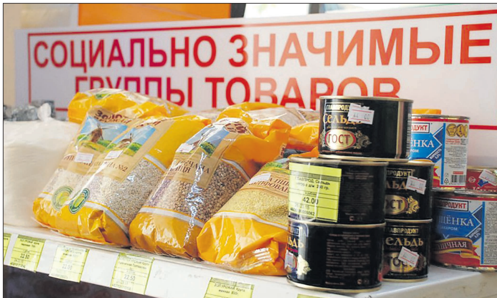
ОФИЦИАЛЬНЫЙ САЙТ ЧЕРЕТОВСКОГО МУНИЦИПАЛЬНОГО РАЙОНА

составил, по данным Росстата, прирост индекса потребительских цен на продовольственные товары за 11 месяцев 2020 года