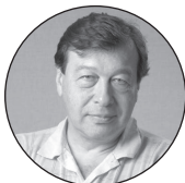
Евгений Гонтмахер, профессор Высшей школы экономики

Я противник административного регулирования цен, в том числе с социальной точки зрения. Наш длительный опыт показывает, что это бесполезно. Это же классика. Цены ползут, кто-то наверху об этом докладывает президенту, он стучит кулаком, и тут же оказывается давление на производителей. Достаточно вспомнить историю с ценами на бензин. Заключались соглашения с нефтяниками, как сейчас с производителями и продавцами растительного масла и сахара. Их прижимают, они терпят месяц, два, три, дальше ситуация меняется, внимание власти к проблеме ослабевает, и все возвращается на круги