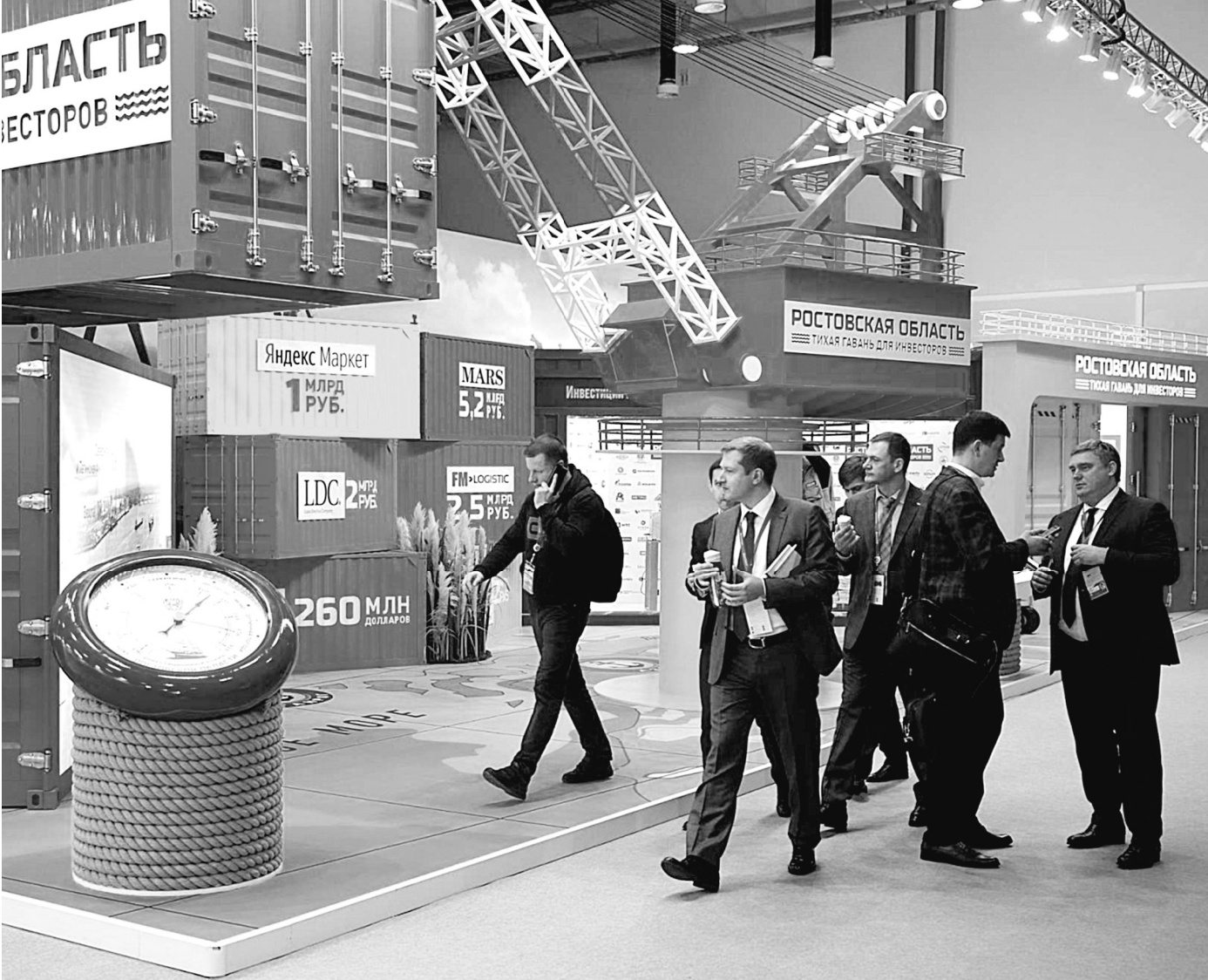
ПРЕСС-СЛУЖБА ПРАВИТЕЛЬСТВА РОСТОВСКОЙ ОБЛАСТИ

Чтобы экспорт и дальние рос, нужны комплексные решения