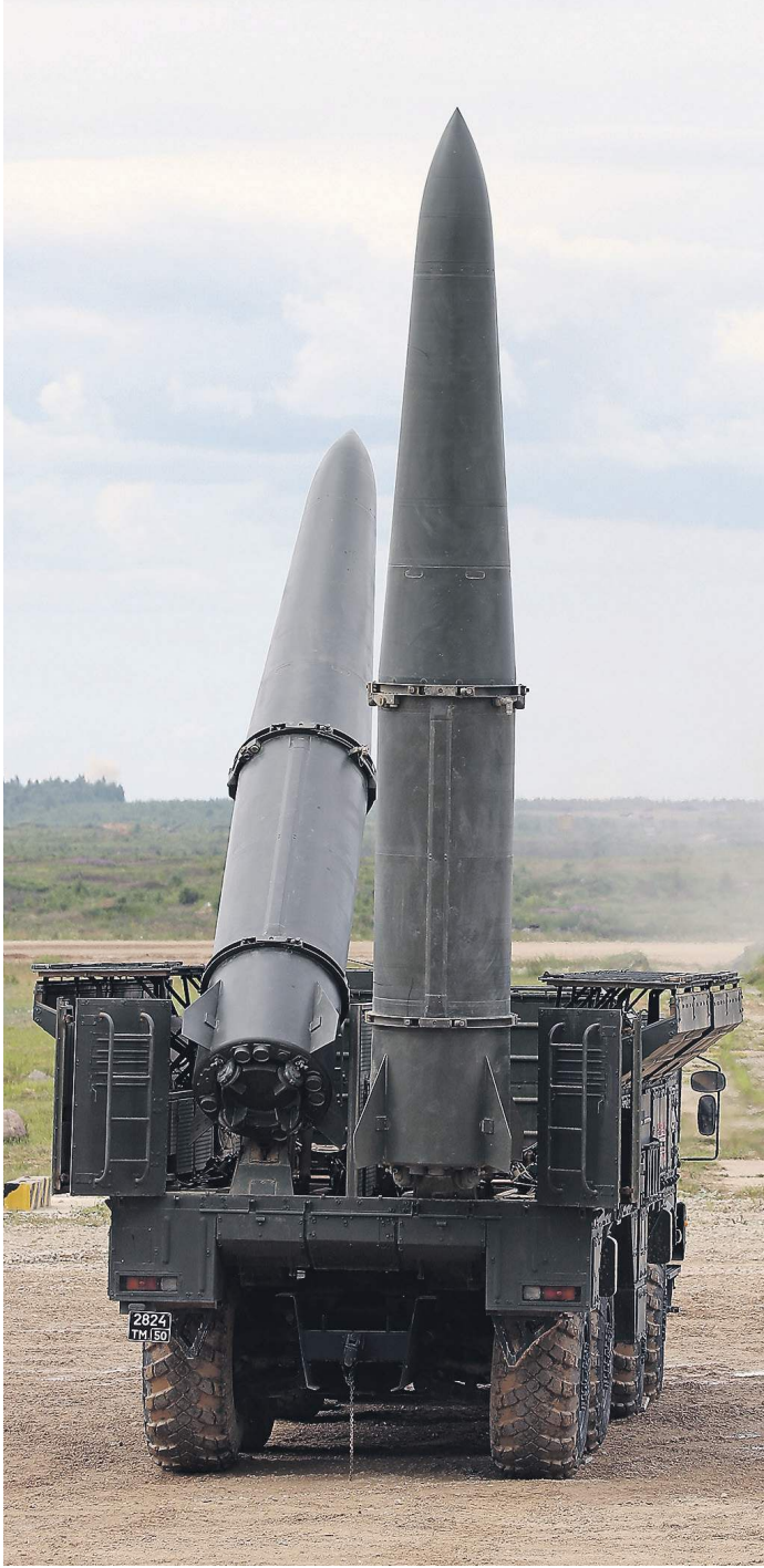
Главные приоритеты нового бюджета — расходы на оборону, выполнение всех социальных обязательств и технологический суверенитет