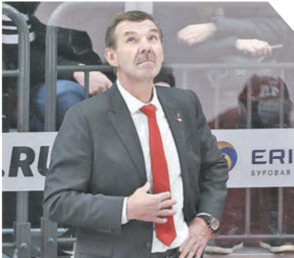
Дарья Исаева «СЗ» / Canon EOS-1D X Mark II