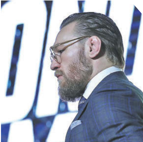
Федор Успенский «СЗ» / Canon EOS-1DX Mark II