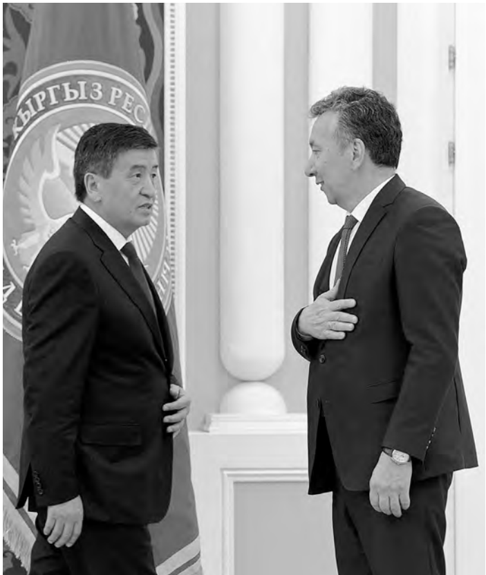
ПРЕСС-СЛУЖБА ПРЕЗИДЕНТА КР

Сотрудники аппарата, как оказалось, отправились в отставку за недоработки или грубые ошибки при подготовке законопроектов или соглашений, связанных с Евразийским союзом или сотрудничеством с Россией. По данным неофициальных источников, по меньшей мере один из таких документов был направлен на подпись президенту. Двое из чиновников поплатились за это