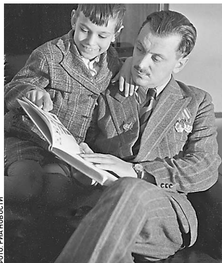
1946 год. Сергей Михалков с сыном Андреем

«Дай Бог МОИМ СЫНОВЬЯМ ТОЖЕ ПРОЖИТЬ 95 ЛЕТ» Интервью классика отечественной литературы — Сергея Михалкова. Сегодня у него юбилей