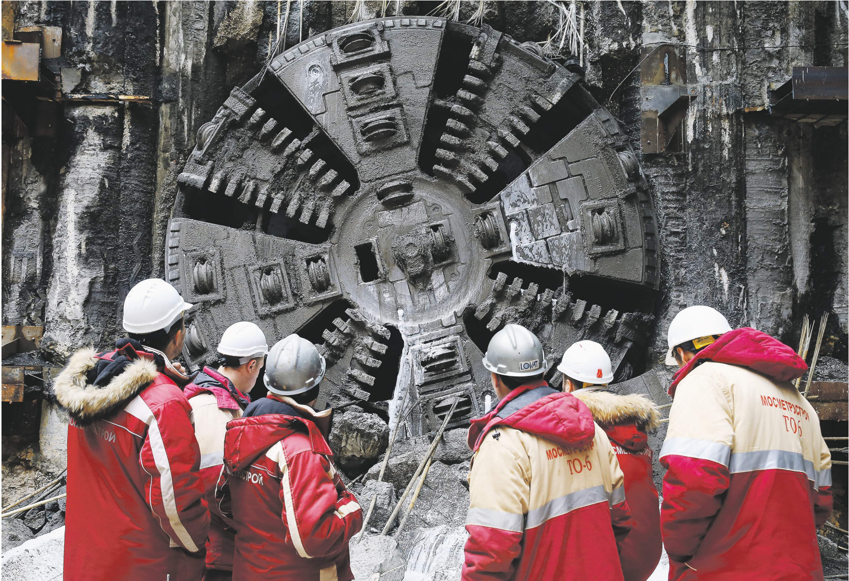
Одним из крупнейших заказчиков засекреченных контрактов является Мосметрострой

Государство излишне увлекается засекречиванием сведений, заявил «Известиям» завлабораторий исследований бюджетной политики РАНХиГС Илья Соколов. Значительная часть информации, которую отнесли к гостайне, может быть публичной без особого ущерба, уверен он. Например, зачастую засекречиваются сведения о закупках для нужд Минобороны и других силовых ведомств, связанные с модерни-