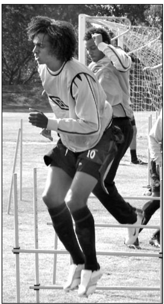
Вчера, Кейсария. ЖО.