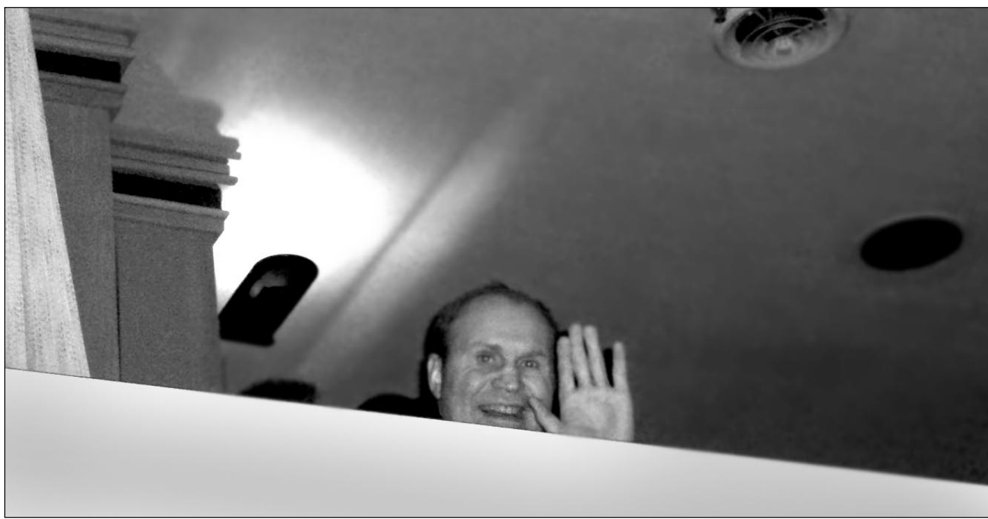
Вчера, Детройт. «Джо Луис Арена». «Детройт» - «Монреаль» - 2:0. Ложа 214. Владимир КОНСТАНТИНОВ, чей портрет висит в одном из залов ледового дворца, приветствует спецкора «СЭ».

Я стоял посреди этой раздалы с разинутым ртом, словно первоклассник в «Детском мире», и поочередно разглядывал фотографии из одного угла (Константинов, Пол Коффи, Лэри Мерфи, Ларионов, свежеснявшийся Стив Айзерман...), как вдруг голос за спиной вывел меня из благоговейного оценивания.