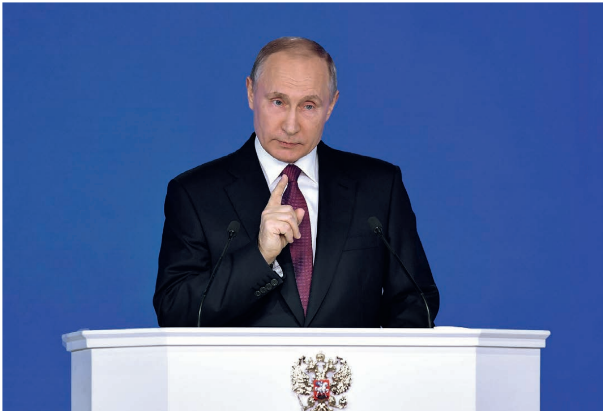
Владимир Путин поставил России задачи на весь следующий президентский срок.

Сбербанк рассматривает возможность запуска пилотного проекта по приему вкладов населения в соответствии с нормами ислама в Татарстане, Чечне и Башкирии.