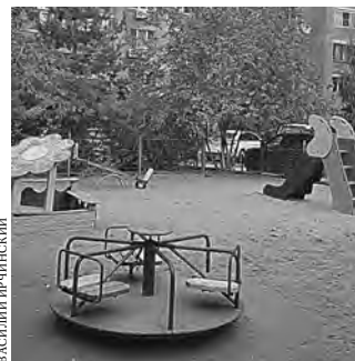
Центральным местом благоустройства становится детская площадка.

В то же время работы на проспекте вызвали немало критики у саратовцев. Хотя муниципальные власти обещали, что в результате реконструкции улица станет зеленее, строители вырубili много деревьев. Кроме