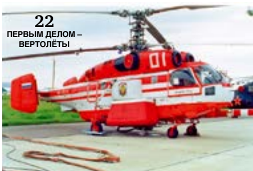
22 ПЕРВЫМ ДЕЛОМ – ВЕРТОЛЁТЫ