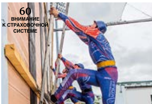
60 ВНИМАНИЕ К СТРАХОВОЧНОЙ СИСТЕМЕ