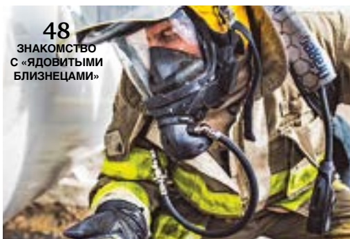
48 ЗНАКОМСТВО С «ЯДОВИТЫМИ БЛИЗНЕЦАМИ»